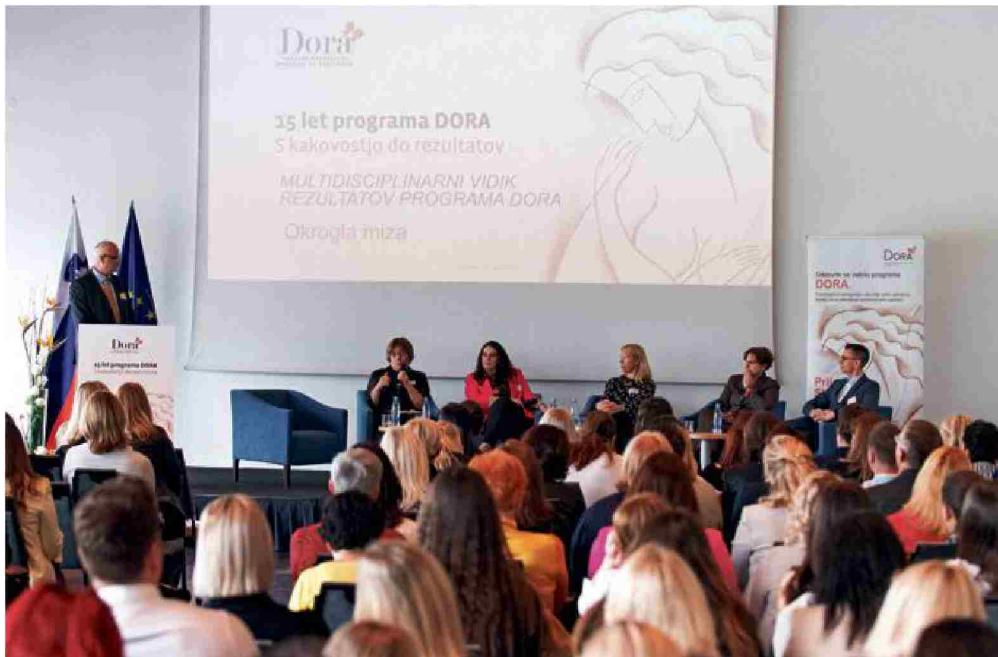
Simpozij ob 15. obletnici programa Dora o multidisciplinarnem vidiku rezultatov programa Dora

zanesljiva in natančna metoda za odkrivanje začetnih rakastih sprememb v dojkah. Zelo dobro prikaže tudi mikrokalcinacije, ki so lahko prvi znak nastajajočega raka. Zaradi visoke občutljivosti se danes uporablja kot prva slikovna preiskava za preventivne preglede navidezno zdravih žensk (brez simptomov bolezni), starejših od 50 let, za preventivne preglede navidezno zdravih žensk, ki so zmerno ogrožene zaradi raka dojk in starejše od 40 let, ter za diagnostični pregled žensk s tipnimi ali vidnimi spremembami na dojkah, ki so starejše od 35 let. Zato ni potrebe, da se odločijo za plačljive preiskave na trgu, saj slovenski zdravstveni sistem zagotavlja zgodnje odkrivanje raka dojk po evropskih smernicah vsem ženskam med 50. in 69. letom v programu Dora .